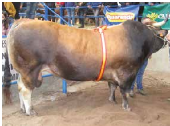
SEMENTAL GRAN CAMPEÓN NACIONAL GRANDA de Joseba A. Urbieta Fano de Vizcaya