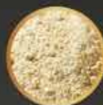
Grasa vegetal By-Pass