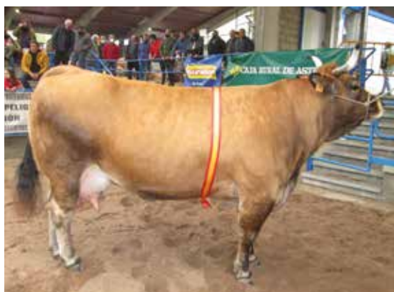
VACA GRAN CAMPEONA NACIONAL PRECIOSA de Inverpor S.L. de Gijón