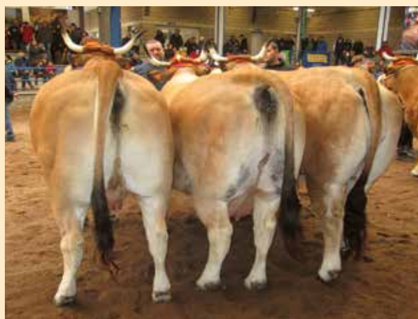
LOTE TIPO CULÓN DE ESTABLO

LOTE presentado por Juana Díaz Castañeda de Las Regueras