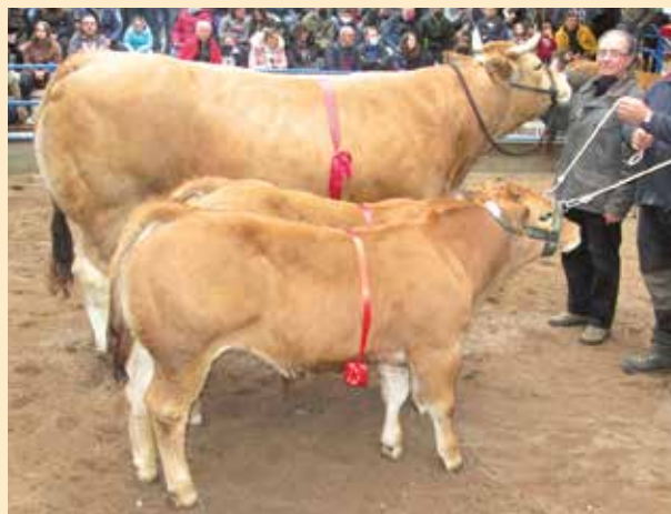
VACA CON CRÍA TIPO CULÓN CAMPEONA NACIONAL