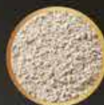
Vitaminas y minerales