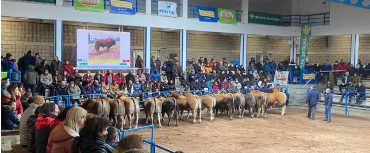
Subasta de Cangas del Narcea

Se subastaron 23 novillos, con un precio medio de 1.765.22 € comprendidos entre los 1.350 € y 4.000€ , con destino a las provincias de León, Galicia y Asturias.