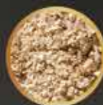
Salvado de trigo