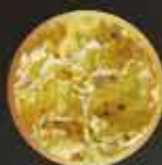
Copos de maiz termoaplastados y molidos