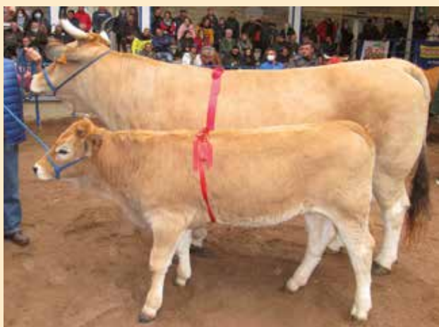
VACA CON CRÍA TIPO NORMAL CAMPEONA NACIONAL