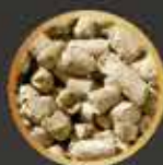
Cascarilla de soja