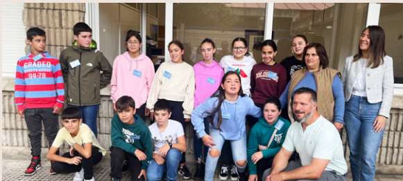
Foto de grupo de participantes en el programa.

En el instituto de Cangas del Narcea se celebró una jornada con alumnos de Primero de la ESO en el que se les enseñó las características de la Raza Asturiana y se visitó una ganadería. Posteriormente en el Concurso Local de Cangas del Narcea los alumnos valoraron unas secciones para poner a prueba sus conocimientos.