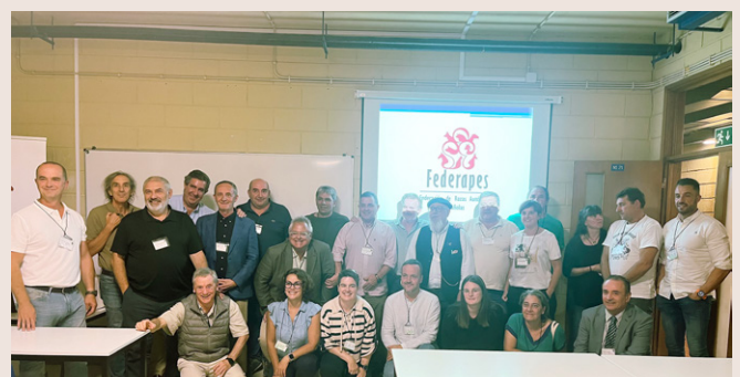
Foto de grupo en la Asamblea General de FEDERAPES.