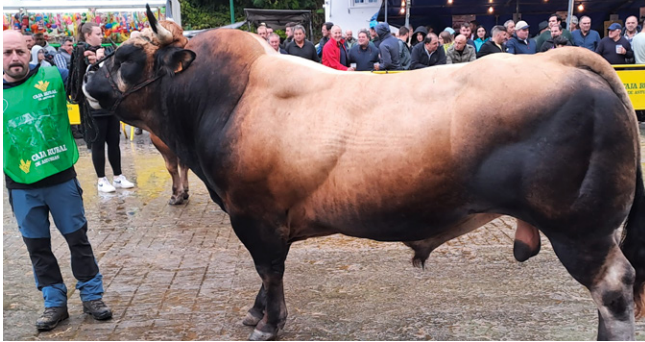
TORO CULÓN NACIONAL