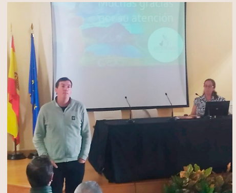
Un momento de la charla sobre EHE.