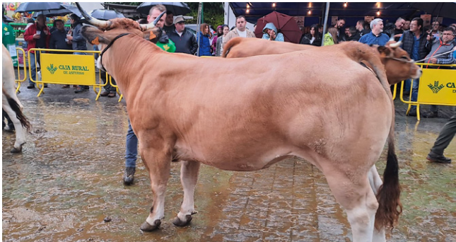
NOVILLA GRAN CAMPEONA T. CULÓN NACIONAL

Ganadería la Pienda S.C. de Las Regueras