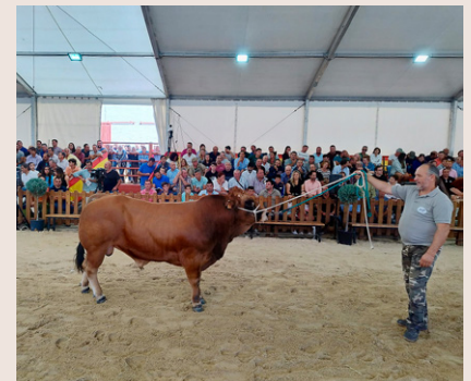
Subastas de Mieres (izquierda) y Salamanca (arriba).