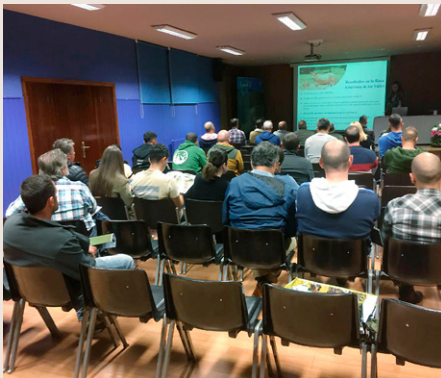
Curso realizado en Lena.