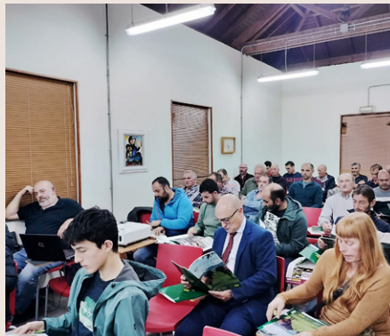
Curso realizado en Aller.