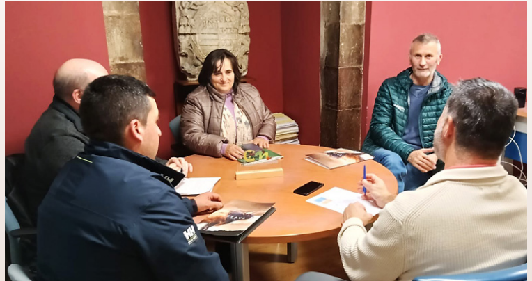
Reunión en el Ayuntamiento de Cangas del Narcea.

19 DE DICIEMBRE DE 2024: Miembros de la Junta Directiva de ASEAVA se reunieron con el Ayuntamiento de Cangas del Narcea para debatir sobre nuevos proyectos en común y el desarrollo de la Raza Asturiana de los Valles.