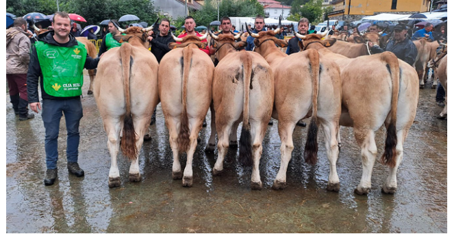
LOTE NOVILLAS CULÓN NACIONAL