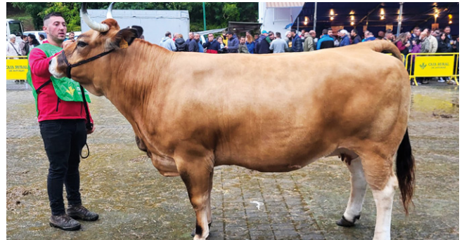
VACA GRAN CAMPEONA T. CULÓN NACIONAL

Ganadería la Pienda S.C. de Las Regueras