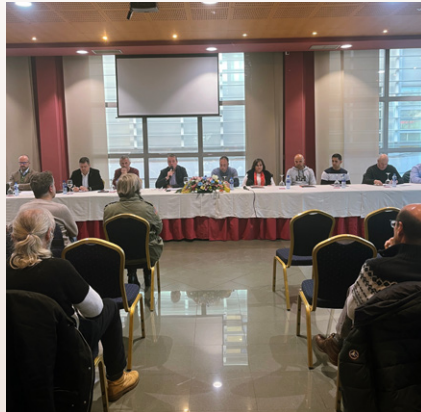
Asamblea extraordinaria de socios.

15 DE DICIEMBRE DE 2024: se celebró una Asamblea extraordinaria de socios en el Hotel Silvota para informar a los ganaderos de las gestiones realizadas hasta el momento y que tomaran decisiones al respecto. Entre otras se tomó la decisión de modificar las cuotas, la transmisión de las participaciones de ASEAMO en la SAT Criadores de Asturias, modificar el objeto social de Asturgen y redistribuir la operativa de ventas y el pago a diferentes acreedores de Xata Roxa.